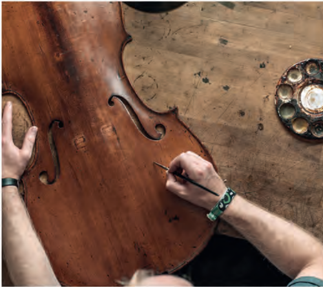
Bis zu 200 Arbeitsstunden werden in den Bau eines neuen Instrumentes investiert.

Werkstatt mit Verkaufsraum in der Christstraße 29